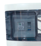
AC-beveiligingskast ECU-productiefollow-up: optioneel